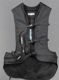
gilet airbag moto