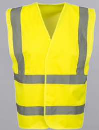
gilet rétro réfléchissant de haute visibilité